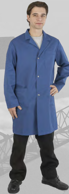
UP 285 royalblau