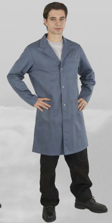
UP 284 swissaiblau

550 Herrenmantel / Blouse de travail Mischgewebe / tissu mixte Gr. 42 – 62