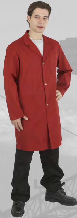
UP 114 rot