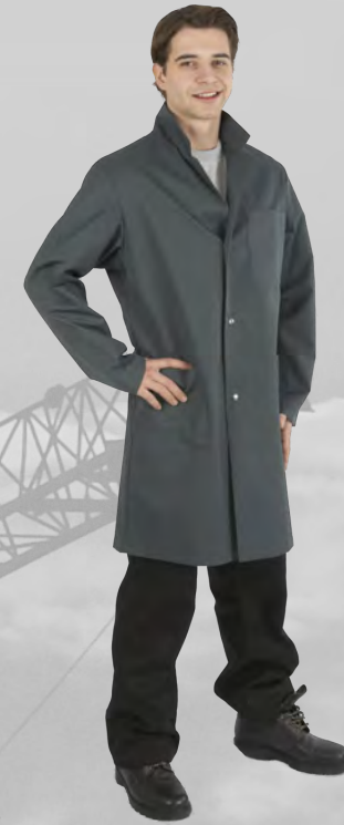
UP 230 spruce green