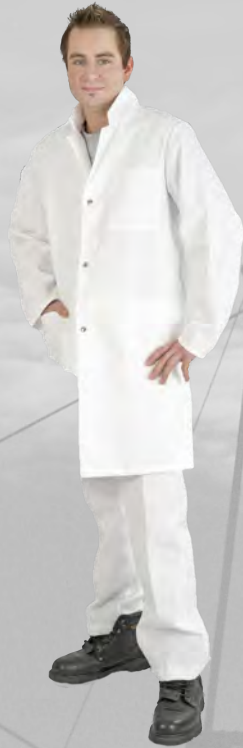
UP 211 weiss